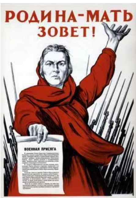
Плакат «Родина-мать зовёт!»

С первых же дней войны никто не смог остаться в стороне от происходящего. Не стали здесь исключением и деятели культуры. Текст песни «Священная война» был опубликован в газетах «Известия» и «Красная звезда» уже через два дня после начала войны. Автор слов этой песни — Василий Иванович Лебедев-Кумач (1898–1949), автор музыки — Александр Васильевич Александров (1883–1946). Ещё одним символом обращения с призывом ко всему народу стал плакат «Родина-мать зовёт!» художника Ираклия Моисеевича Тоидзе.